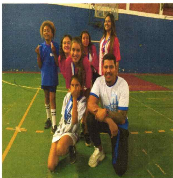
Oficina de Esportes – CopaMazza 21/09