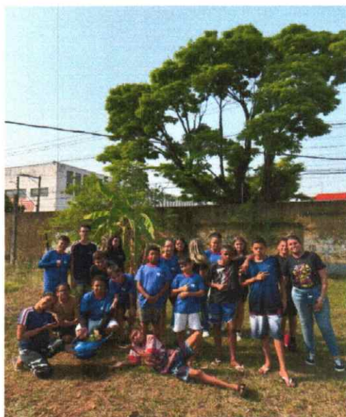
Oficina de Educação Socioambiental – Plantio 04/09

IMPACTO SOCIAL: Foram capazes de demonstrar emoção, autocontrole e de interação no processo de fortalecimento de vínculos interpessoal, institucional, familiar e comunitário, tais como: Ser forte; comunicativo; desenvolver novas habilidades sociais, culturais e artísticas; diminuição de conflitos pessoais e/ou em grupo; realização de tarefas coletivas. Redução das expressões de vulnerabilidades sociais presentes no cotidiano das crianças e adolescentes atendidos.