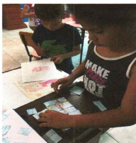
Oficina de Educomunicação - Quebra Cabeça 16/09