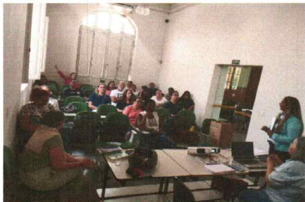
Reunião do CMDCA 05/09/2024

Observações – As reuniões do CMDCA estão sendo realizadas no Centro de Capacitação e Formação de Professores (Prédio da Estação), localizado na Praça Condessa de Frontin, nº 76, Centro Histórico