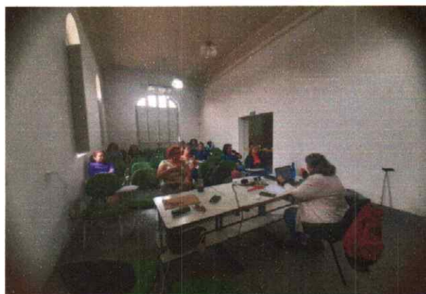
Reunião do CMDCA 19/09/2024

OBJETIVO ESPECÍFICO: Oportunizar o acesso às informações sobre direitos e sobre participação cidadã, estimulando o desenvolvimento do protagonismo dos usuários.